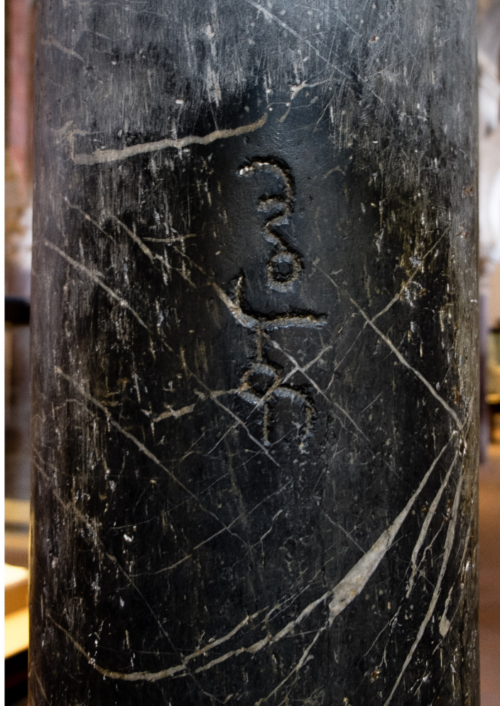
BILD 61 Steinmetzzeichen in der Mezquita von Córdoba

Hätte man mich nicht darauf hingewiesen, so wären mir sicher die Steinmetzzeichen ( Bild 61 ) nicht aufgefallen, die es hier genauso gibt wie etwa in unseren mitteleuropäischen Kathedralen!