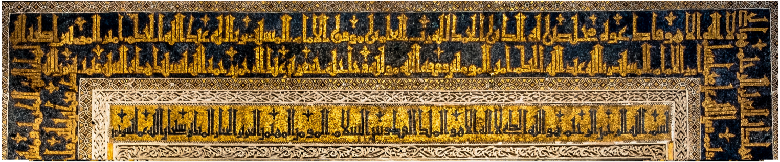
BILD 55 Kufisches Schriftband am Mihrab

Die Palmenschäfte werden von einer Doppelreihe von Bögen gekrönt, die eine Erhöhung des Bauwerkes bei einer großen Leichtigkeit ermöglichen. Denn anders als die römischen Aquädukte, welche die muslimischen Baumeister mindestens von dem dreigeschossigen aus Mérida gekannt haben müssen, brauchten hier die Bögen nur eine minimale Masse zu tragen und wurden entsprechend leichtgewichtig und elegant.