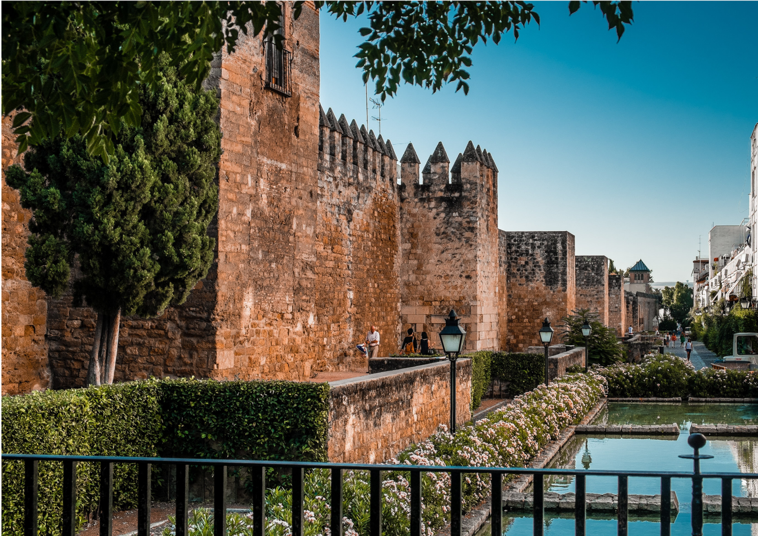
BILD 62 An der Stadtmauer von Córdoba

Den Nachmittag füllte eine Exkursion mit dem Bus aus. Zunächst kamen wir wieder an dem imposanten Wasserrad ( Bild 65 ) im Guadalquivir vorbei, das wohl dazu gedient hat, eine Mühle anzutreiben, ein beeindruckendes Beispiel arabischer Wassertechnik. Es sind nur noch Bruchstücke der Anlage erhalten, aber für die Möven ist das noch immer ein bequemer Ruheplatz. Hinter dem Rad erkennt man die Römische Brücke mit ihren sechzehn Bögen, die am Torre de la Calahorra endet.