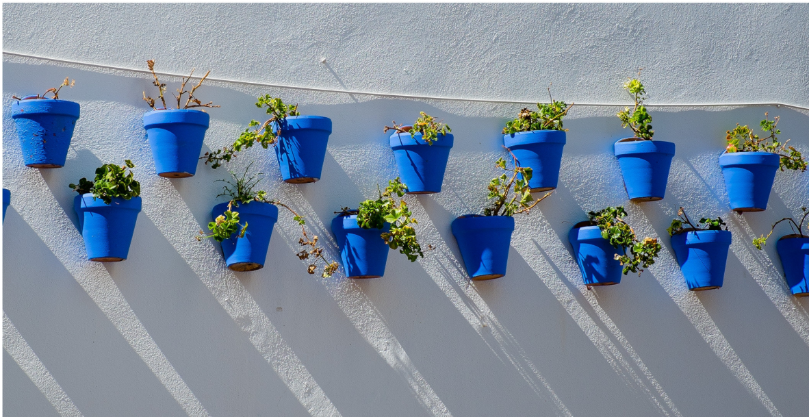
BILD 52 Blumentöpfe in der Calleja de las flores

<< BILD 50 Ein westgotisches Bodenmosaik unter der Mezquita