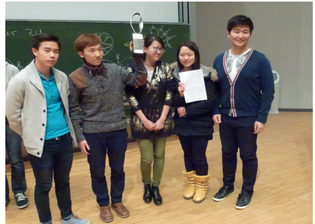
Sieger im Gruppenwettbewerb: Salem College Spetzgart