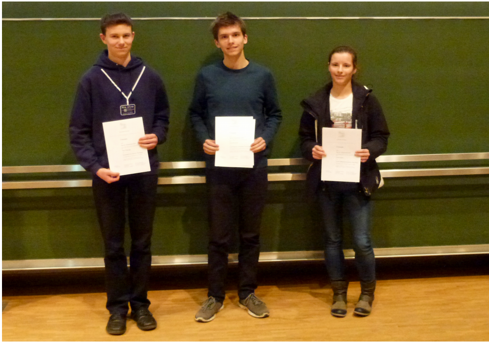
Die Sieger im Einzelwettbewerb

2. Platz im Gruppenwettbewerb: Salem College Spetzgart, Team 2