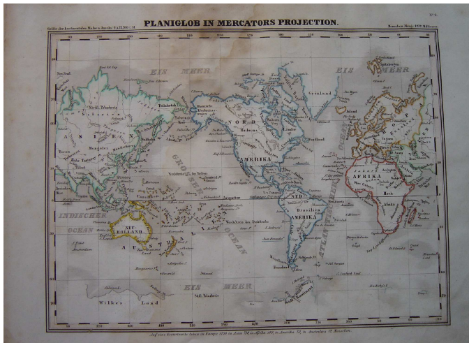
Mercators Projektion: Prototyp der Weltkarte

Aus einem Schulatlas um 1850: „Als Australien noch Neu-Holland hieß, Alaska zu den russische Besitzungen zählte, das Franz-Josef Land noch unentdeckt war und die Erde von nur 1272 Millionen Seelen bevölkert wurde.“